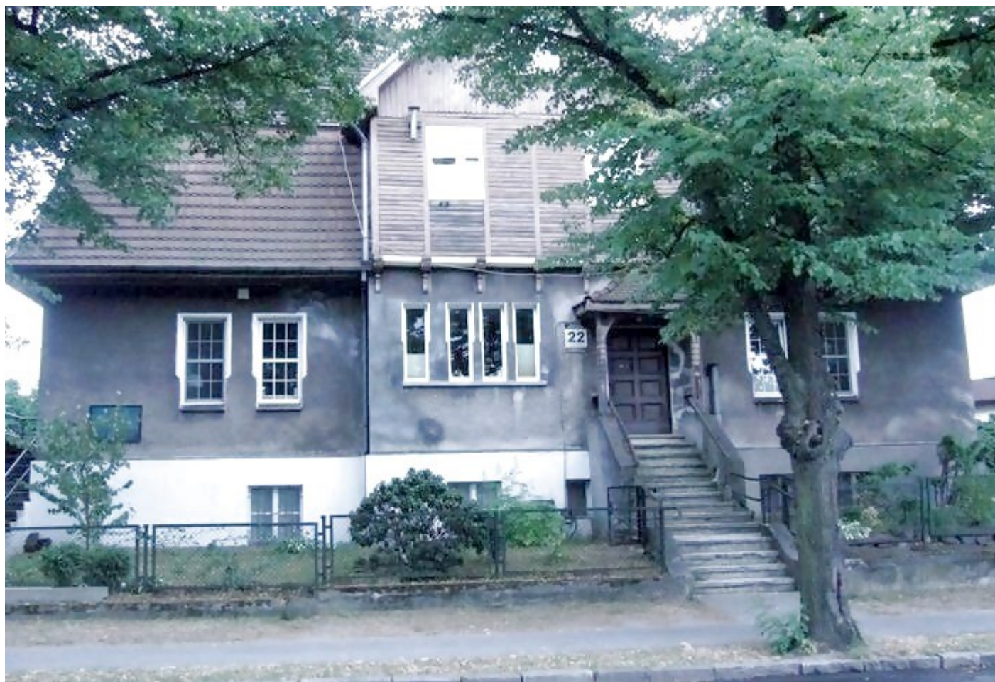
Dom przy ul. (obecnie ul. Piastowska nr.22) w Gdańsku Oliwie należący w latach 1935 - 1936 do rodziny Modrowów w którym powołano Pakt Rbbentrop - Mołotow